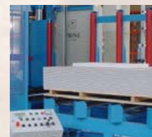
cięcie płyt gipsowo-kartonowych