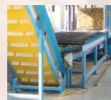
zintegrowane przenośniki do odprowadzania odpadów