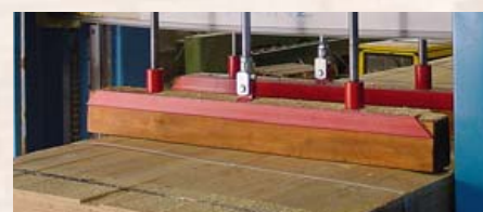
dociskanie pakietu przy cięciu