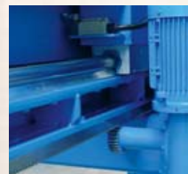
precyzyjne prowadzenie jednostki tnącej