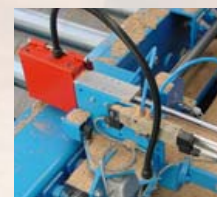
automatyczny układ pomiarowy