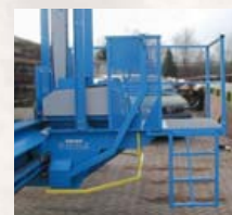
wygodna platforma operatora