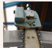
stabilne prowadzenie prowadnicy