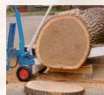
również do kapowania drewna okrągłego