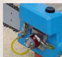
smarowanie układu tnącego